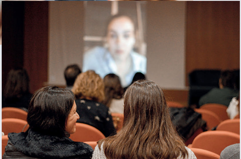
Vídeo Welcome Days